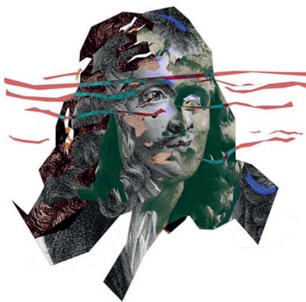
Illustration : Nathanaël Fleuriné

Nouvelle-France, 1673. Un navire venant de France et transportant, entre autres, une grande quantité de livres, fait naufrage tout près de Québec. Fouillant l'épave échouée sur la rive, des pêcheurs trouvent des fragments de livres flottant sur l'eau et les apportent au Gouverneur Frontenac. Reconnaisant dans ces rebuts des bribes de certaines pièces de Molière, le lieutenant Mareuil entreprend de reconstituer ces pièces. Mais avec les feuillets détremvés, l'écriture délavée et quasi illisible, la tâche est colossale. Croyant avoir réussi à restaurer une des pièces, il décide de la monter mais, en réalité, le résultat s'avère être un pot-pourri qui en étonnera plus d'un !